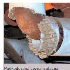
Poškodovana cevna izolacija