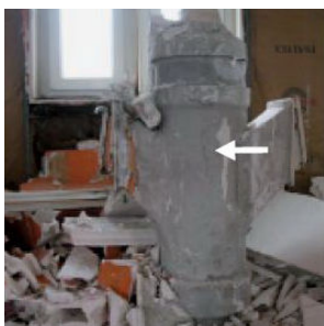
Cementno vezane grelne cevi