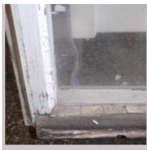
Leseno okno s kitom