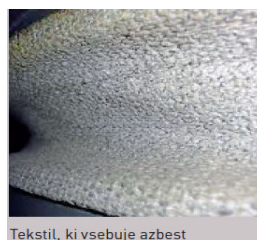
Tekstil, ki vsebuje azbest

vinaz plošče, linoleji z azbestnimi vlakni